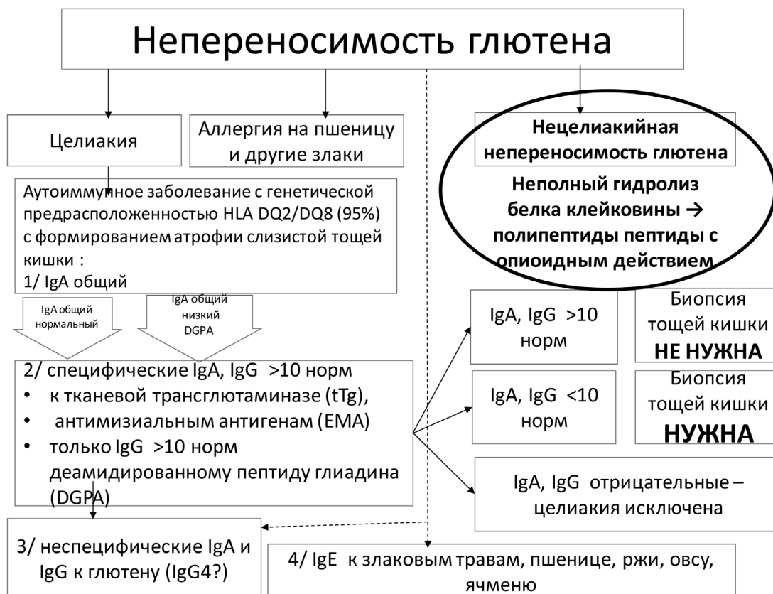
Рис. 1. Схема непереносимости глютена, диагностические маркеры. Выделен фрагмент нецелиакийной непереносимости, свойственной детям с РАС

жирную, диету бывает полезен не только за счет смещения метаболизма с углеводов на жиры. Так вот, в сое более 6000 мг/100 г глутаминовой кислоты, затем меньше — в зеленом горошке и сыре пармезан, и только потом следуют сорта мяса (говядина — 2800) и т.п.