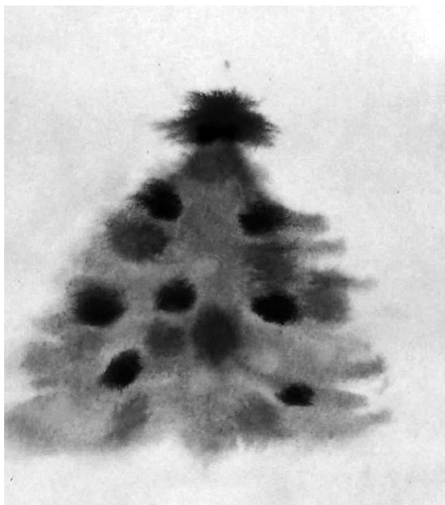
После отработанных тем новогодних праздников произошли позитивные сдвиги в контактах