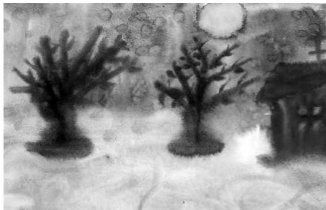
Одна из первых работ Саши. Много темных тонов, нет ни одного живого существа.