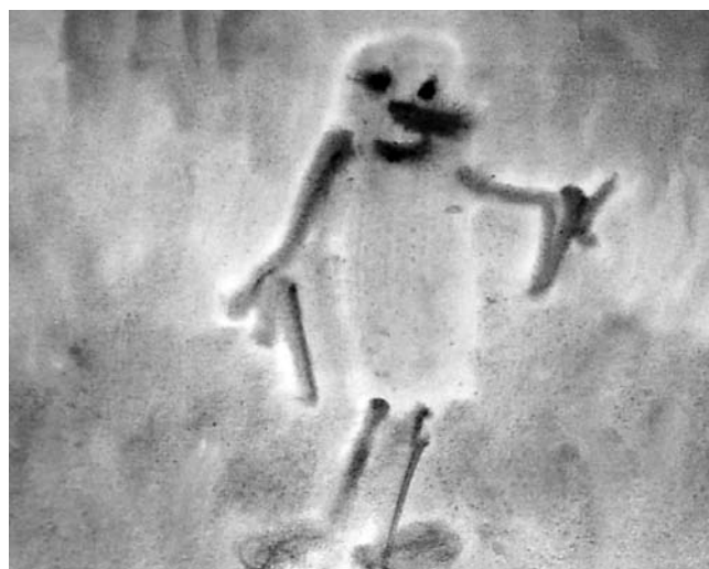
«Леший». Работа выполнена в конце первого года обучения почти самостоятельно.