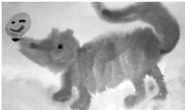
Второй год обучения. Удерживается цельность образа.