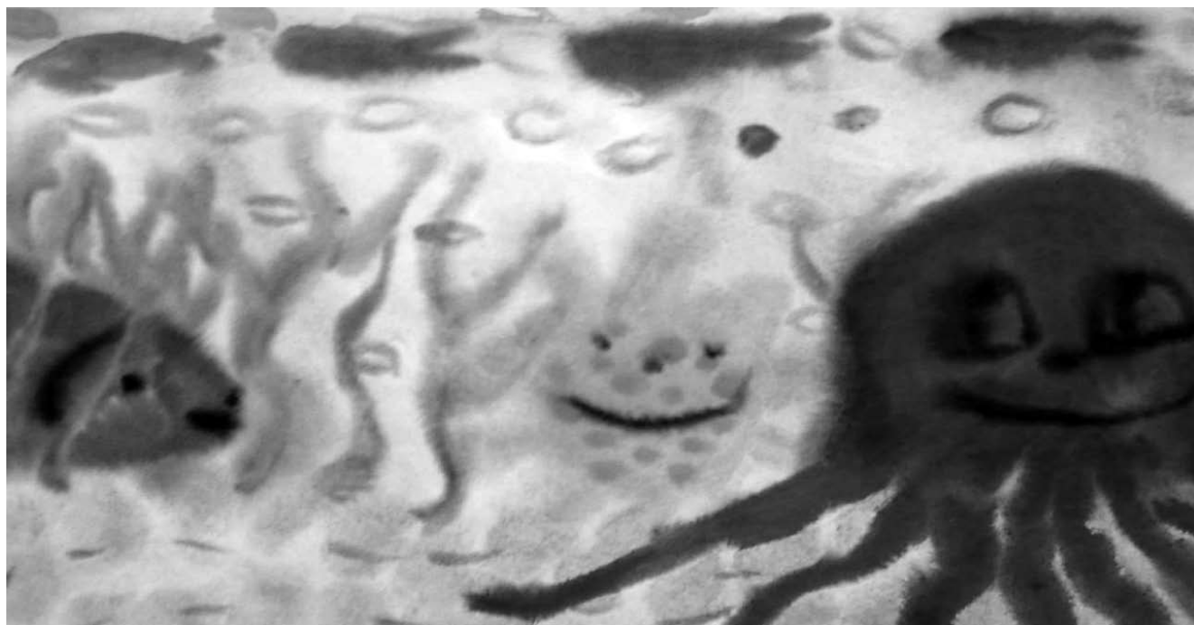
Работа выполнена через полгода. Уже присутствует общение между персонажами, цвета более насыщенные и светлые.