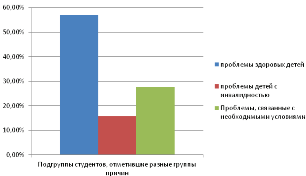
Рис. 3. Соотношение студенток, выделивших различные причины затруднения организации инклюзивного образования

Из таблицы видно, что только причины первой группы положительно связаны с мнением об инклюзивном образовании. Это, скорее всего, обуславливается тем, что большинство респонденток, высказывая свое мнение об инклюзии, основывались на личном опыте общения с лицами с ин-