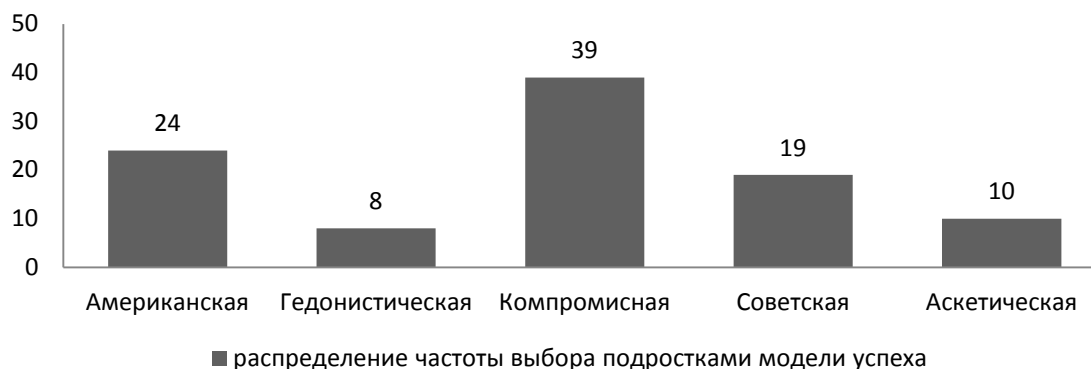
Рис. 2. Исследование представлений об успехе

На следующем этапе, используя методику О.Ю. Ключковой «Исследование представлений об успехе», мы изучили особенности представлений об успехе подростков. Выявлена тенденция к преобладанию компромиссной и американской моделей успеха в подростковой среде (рис. 2).