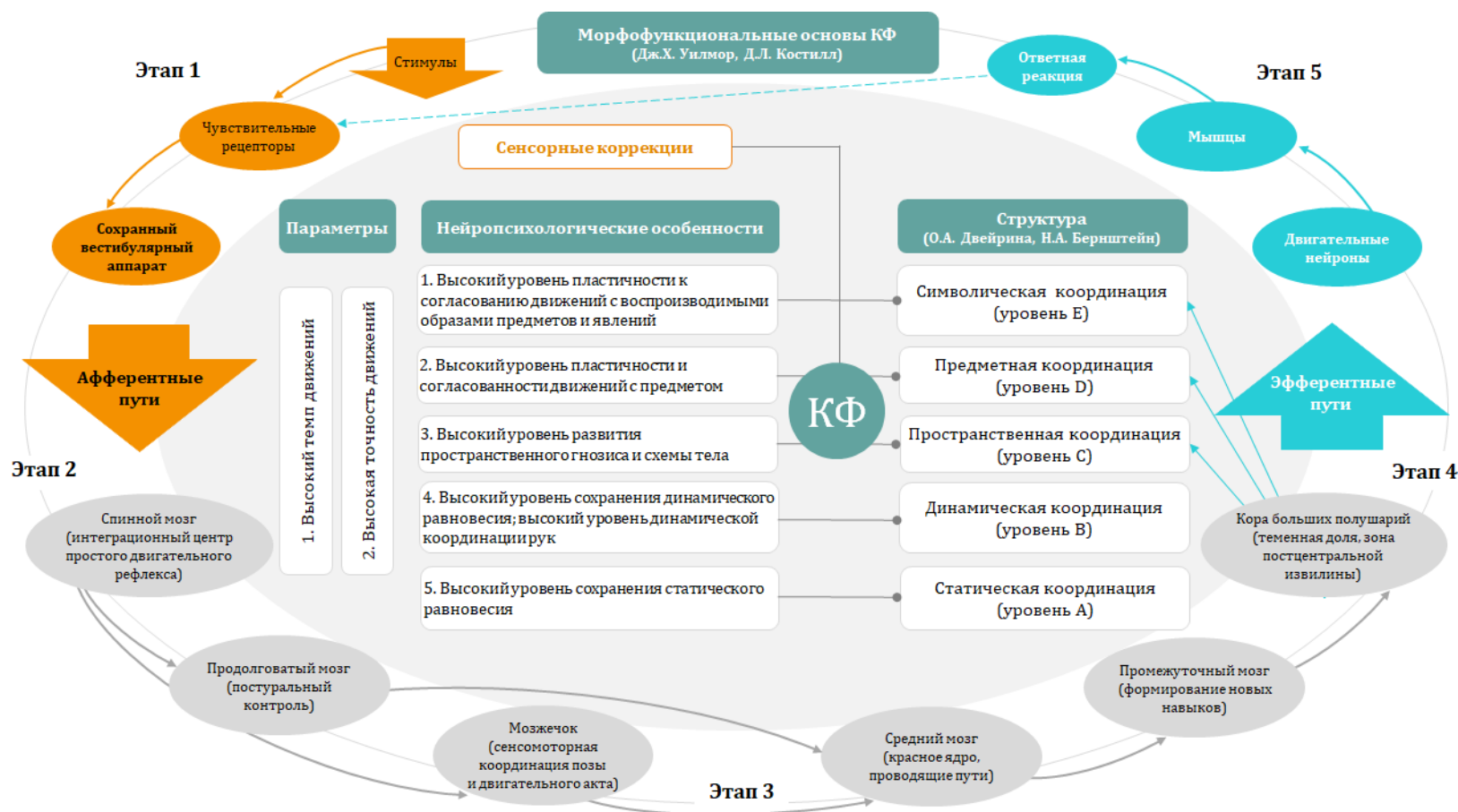
Рис. 1. Схема концептуальной модели исследования особенностей координационных функций у детей младшего школьного возраста без нарушения слуха

Примечания: КФ — координационная функция; оранжевый цвет — сенсорный процесс; голубой цвет — моторный процесс; серый цвет — морфофункциональные основания координационных функций.