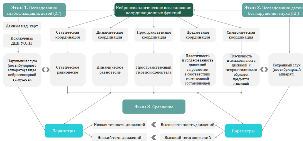
Рис. 3. Схема дизайна эмпирического исследования особенностей координационных функций у слабослышащих детей младшего школьного возраста от 7 до 11 лет

В целом, рассматривая координационные функции, можно выделить два нейропсихологических параметра движений: темп и точность их выполнения. В соответствии со схемой концептуальной модели исследования особенностей координационных функций у слабослышащих детей младшего школьного возраста, разработана схема дизайна эмпирического исследования (рис. 3).