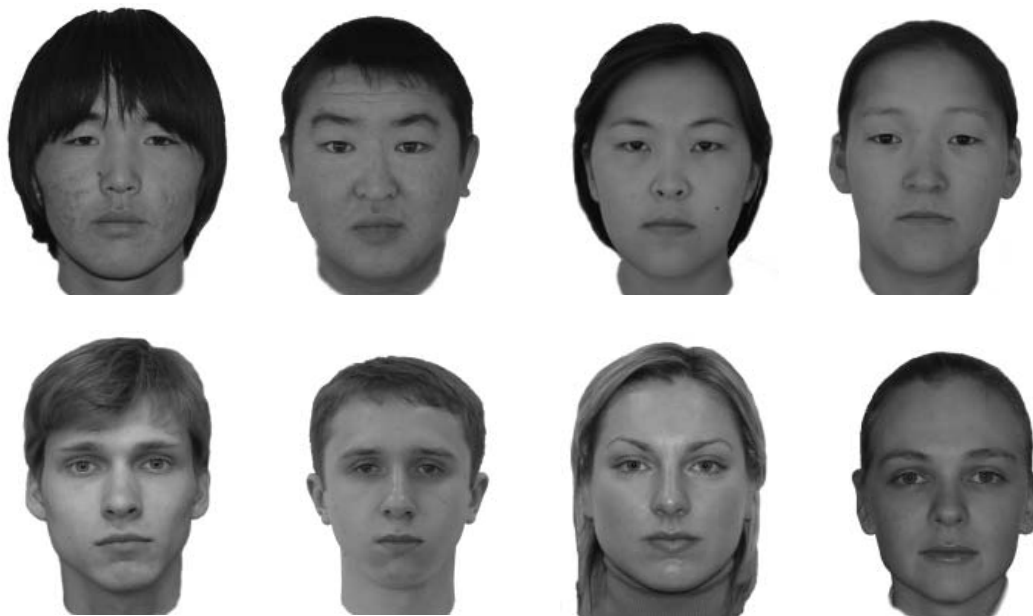
Рис. 1. Фотоизображения лиц натурщиков представителей монголоидной и европеоидной расовых групп, использованных в исследовании

Испытуемые оценивали выраженность индивидуально-психологических особенностей натурщиков, изображенных на фотографиях, с помощью методики «Личностный дифференциал». Перед началом эксперимента определялись личностные профили самих испытуемых с использованием той же методики.