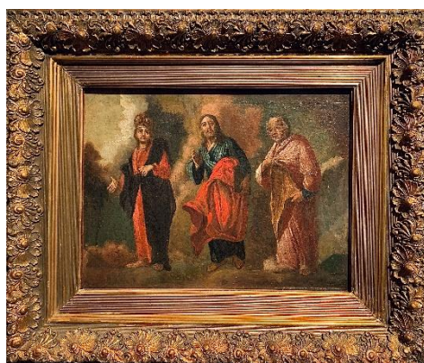
Рис. 2. Неизвестный художник круга Владимира Боровиковского Три жестикулирующих апостола, идущие в левую сторону 1780-е