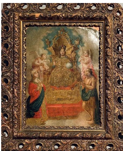
Рис. 1. Владимир Боровиковский Царь во славе. Композиция на евангельскую тему 1780-е

На выставке представлены замечательные работы кисти Владимира Лукича Боровиковского и художников его круга: «Царь во славе» (1780-е), «Три жестикулирующих апостола» (1780-е) и «Распятие» (кон. XVIII – нач. XIX вв.). Выбор тем, колорит произведений, их композиционный строй и эмоциональность – всё исполнено барочного драматизма и классической красоты античности.