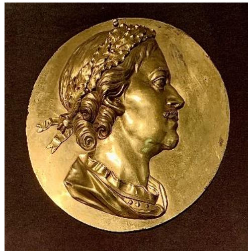
Рис. 5. Неизвестный скульптор круга Этьена М. Фальконе Портрет императора Петра I XVIII век

Dostoevsky, Florence and images of Russian spirituality. Reflections at the exhibition "From Baroque to Art Nouveau" by Vasily Tropinin`s Museum in Moscow Language and Text. 2022. Vol. 9, no. 3, pp. 31–38.