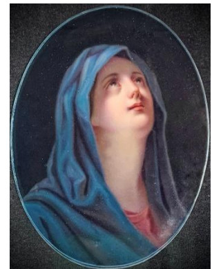
Рис. 14. Неизвестный художник Молящаяся XIX век

Совершая прогулку по выставке, чувствуешь глубокую и тёплую благодарность ее создателям, которые с таким вниманием и любовью сложили изящный живописный аккорд – размышление об образах русской духовности в искусстве XVIII-XIX столетий... Останавливаешься у Рафаэлевского сюжета «Мадонны в креслах» во вдохновенном копийном исполнении неизвестного художника, тебя обволакивает мягкость колорита и