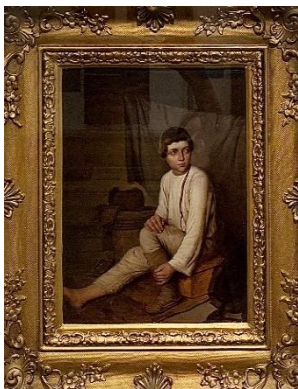
Рис. 11. Неизвестный художник Мальчик, надевающий лапти. Копия картины А.Г. Венецианова 1840-е

...живописи, сформировавшейся в культурно-историческом диалоге России и Европы и запечатлевшей тончайшие грани духовной красоты нашего отечества: от трогательной чистоты Венецианских народных мотивов до глубины психологического портрета, «европейского» переосмысления евангельских сюжетов и морально-нравственной, национальной направленности передвижников.