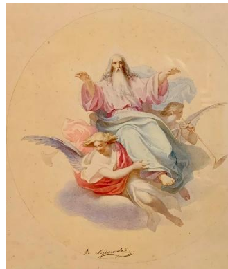
Рис. 13. Василий Худяков Эскиз плафона Господь Саваоф с ангелами 1850-е