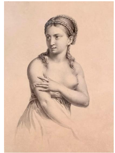
Рис. 10. Василий Тропинин Полуобнажённая женщина 1810 год

...живописи, сформировавшейся в культурно-историческом диалоге России и Европы и запечатлевшей тончайшие грани духовной красоты нашего отечества: от трогательной чистоты Венецианских народных мотивов до глубины психологического портрета, «европейского» переосмысления евангельских сюжетов и морально-нравственной, национальной направленности передвижников.