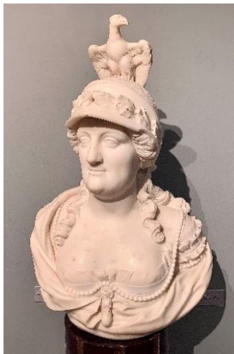
Рис. 4. Неизвестный скульптор Портрет Екатерины II в образе Минервы Последн. четв. XVIII века

Достоевский, Флоренция и образы русской духовности. Размышления на выставке «От барокко до модерна» в музее В.А. Тропинина в Москве Язык и текст. 2022. Том 9. № 3. С. 31–38.