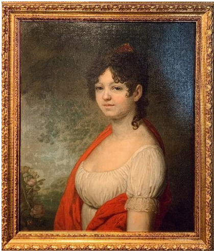
Рис. 8. Владимир Боровиковский Портрет Варвары Андреевны Томиловой 1800-е

Dostoevsky, Florence and images of Russian spirituality. Reflections at the exhibition "From Baroque to Art Nouveau" by Vasily Tropinin's Museum in Moscow Language and Text. 2022. Vol. 9, no. 3, pp. 31–38.