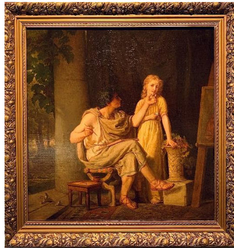
Рис. 9. Александр Витберг Античный художник Первая пол. XIX века