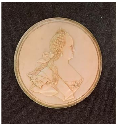
Рис. 6. Медальон с профильным изображением Екатерины II Вторая пол. XVIII века