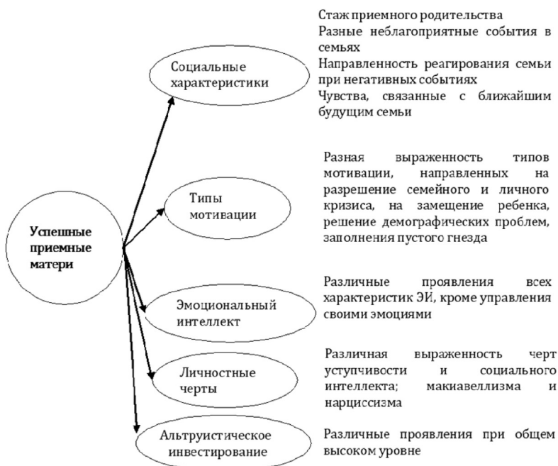
Рис. 3. Вариантные характеристики приемных матерей