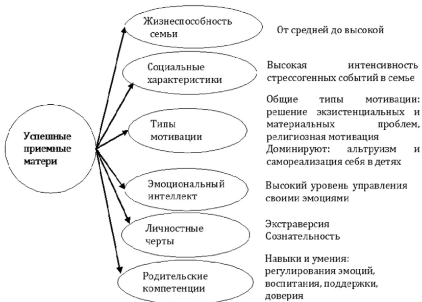
Рис. 2. Инвариантные характеристики успешных приемных матерей