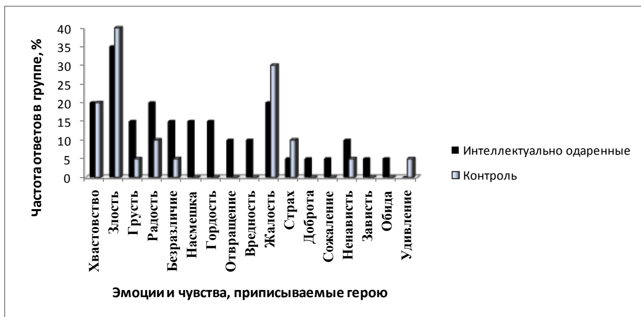
Рис. 1. Частота встречаемости ответов на вопрос к отрывку из сказки «Дюймовочка» в контрольной группе и группе интеллектуально одаренных детей в возрасте 9–10 лет

Последние исследования С.А. Кочергиной, также выполненные под нашим руководством, свидетельствуют и о более высокой эмоциональной отзывчивости интеллектуально одаренных детей в возрасте 7–8 лет на музыку по сравнению с их сверстниками. Одаренные дети не просто владеют более обширным словарем эмоций, но и проявляют больший интерес и активность в ходе прослушивания музыки, точнее определяют и передают эмоциональный характер музыкального произведения [1].