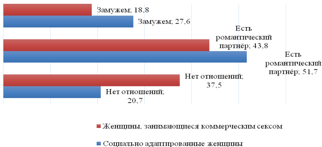
Рис. 1. Характеристика отношений для проституток и социально адаптированных женщин, %

Статистически значимые различия были получены по показателю наличия и количества детей ( \chi^2=6,062 ; p=0,048 ). В частности, у большинства секс-работниц 1 ребенок (46,9%), нет детей у 37,5%, двое детей — у 15,6%. В группе социально адаптированных женщин большинство не имеют детей (69,0%), один ребенок — у 24,1% и двое — у 6,9%. Таким образом, можно предположить, что занятие коммерческим сексом не мешает женщинам строить и поддерживать отношения с молодыми людьми, выходить замуж и рожать детей.