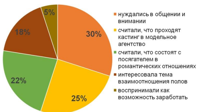
Рис. 2. Причины, по которым девочки вступали во взаимодействие с посягателем

При изучении особенностей криминальной ситуации анализу подвергались причины, по которым девочки вступали в коммуникацию с посягателем, влияние социального окружения на вовлечение девочек в общение с грумером, возможное офлайн-взаимодействие жертв и преступника. Обнаруживались различные виды мотивов, побуждавшие девочек включаться в контакт с посягателем. Часть из них были связаны с ситуацией правонарушения, часть — с индивидуальными особенностями жертв (рис. 2).