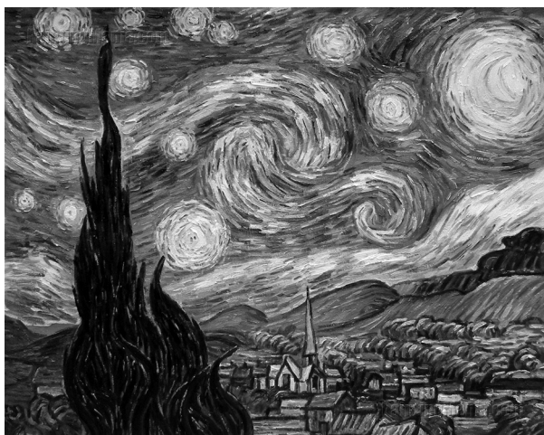
В. Ван Гог. «Звездная ночь»

шивал несколько раз дома «с жадностью и восторгом» и выполнил на него рисунок, имеющий сходство с картиной «Звёздная ночь» (ночь, звезды, горы).