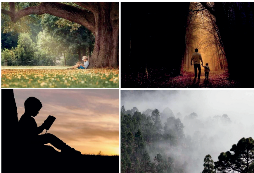
Рис. 1. Стимульный материал методики К. Адамс «Пространство дерева и света»

На первой, названной автором « Живое пространство », изображен ребенок, сидящий около величественного дерева, корни которого уходят глубоко в землю, а большая крона служит защитой. Это самое яркое из пространств, символизирующее прочную основу и защиту. На второй картинке « Мерцающее пространство » изображен темный густой лес, дорога, по которой идет ребенок, поддерживаемый взрослым, и свет, который пробивается сквозь деревья, освещая путникам дорогу. По мнению К. Адамс, это пространство символизирует стремление к пониманию своей культуры и традиций при поддержке взрослого. На третьей картинке « Непрозрачное пространство » изображены сумерки, солнце уходит за горизонт, практически не видно дерева, но хорошо различим темный силуэт ребенка. Картина символизирует одиночество, тревогу, беспокойство и страх. Традиции еще присутствуют, но есть разрывы, противоречия и нет ощущения поддержки. Четвертая картинка изображает « Невидимое пространство » с деревьями в тумане, на картине нет ребенка. Иллюстрация символизирует сомнения, неприятие других, отдаленность от традиций и культуры, «утрату корней».