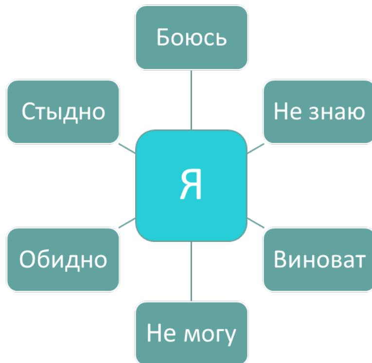
Рис. 1. Базовая семантическая тематика подсознательных комплексов тревоги

Список тем, который приведен ниже, составляет конечный вариант семантики основных проблемных тем опыта жизнедеятельности личности, которые отражаются как деструктивные семантические (смысловые) комплексы его подсознательной (связаны с индивидуальным опытом) ПСО (рис. 1).