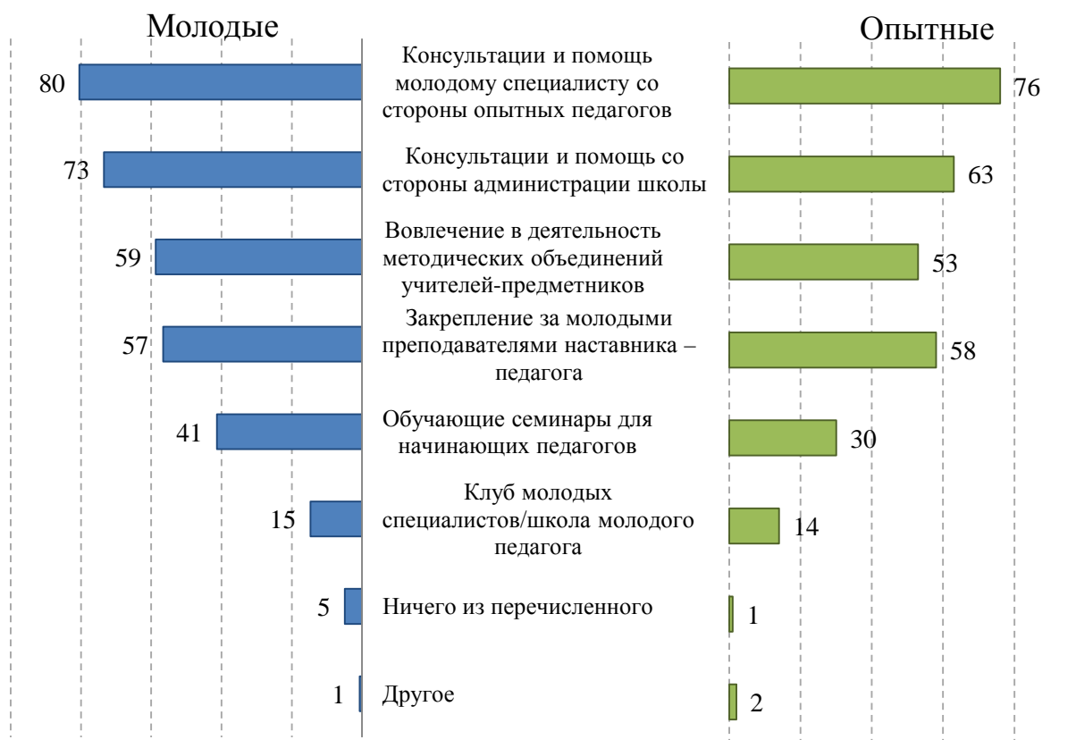
Рис. 2. Основные формы поддержки молодых педагогов (по мнению молодых педагогов и их опытных коллег; %). Вопрос начинающим педагогам: «Укажите, пожалуйста, какие формы поддержки начинающих педагогов существуют в вашей школе?» Вопрос опытным педагогам: «Укажите, пожалуйста, какие формы взаимодействия с молодыми педагогами существуют в вашей школе?»

Степень участия начинающих педагогов в обозначенных формах профессиональной поддержки в целом совпадает с предоставленными в школе возможностями, но по некоторым аспектам различается. Например, такие формы поддержки, как «закрепление за молодым преподавателем наставника» и «вовлечение в деятельность методических объединений учителей-предметников», в школе созданы, но современные молодые специалисты ими пользуются не всегда (рис. 3).