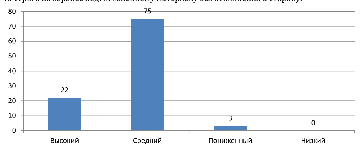
Рис. 2. Результаты оценки коммуникативных умений учащихся по методике А. Навантерри по уровням овладения (%)

Абсолютное меньшинство детей (3 %) испытывают некоторые коммуникативные трудности, например, им сложно устанавливать новые социальные связи, особенно если это требуется сделать в незнакомой обстановке. Эти учащиеся могут по-настоящему уверенно ощущать себя только в окружении хорошо знакомых людей. Если они и соглашаются на публичные выступления (доклады, сообщения перед классом или несколькими классами), то строго по заранее подготовленному материалу без отклонения в сторону.