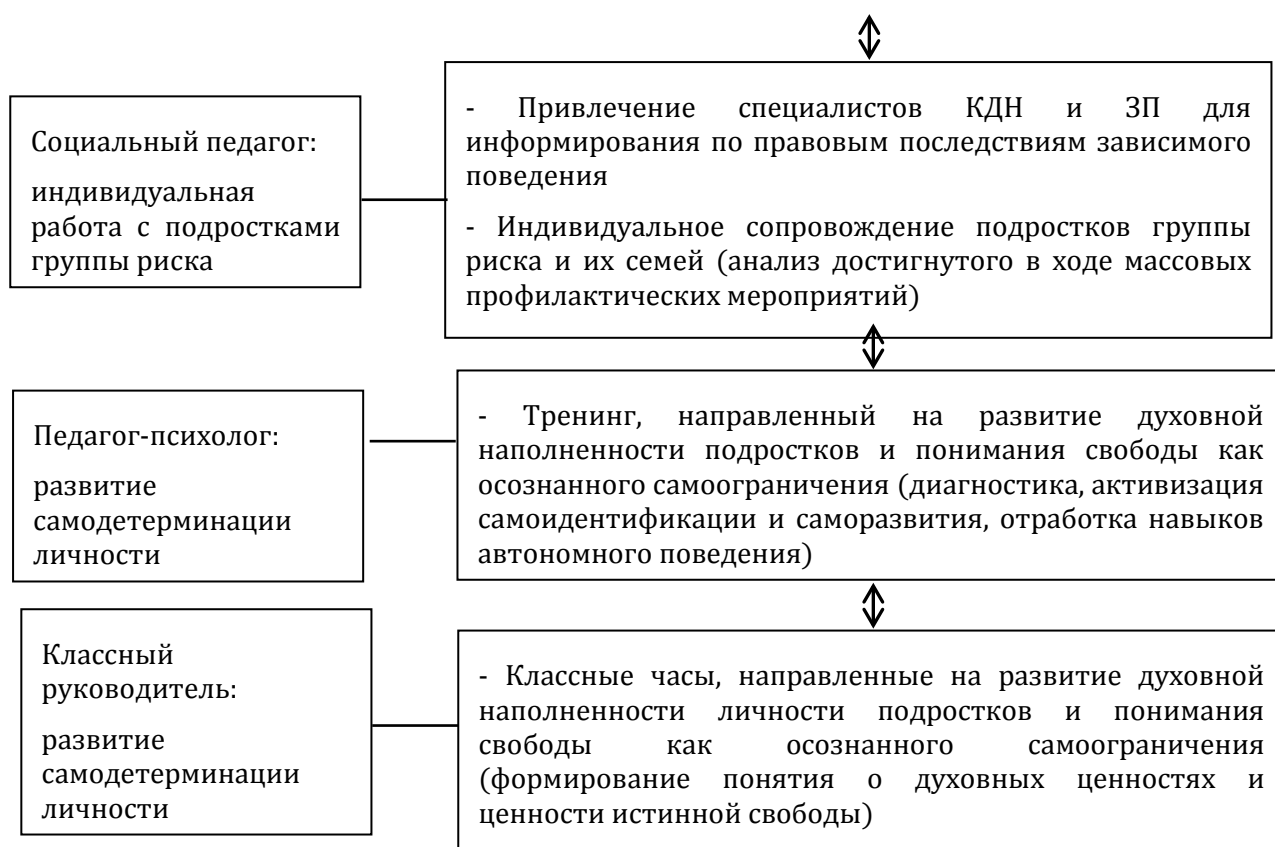
Рис. Модель взаимодействия специалистов образования в ходе профилактики зависимого поведения в образовательной организации

Согласно данной модели, содержание деятельности специалистов образовательной организации по развитию самодетерминации учащихся подросткового возраста предполагает следующие этапы работы.