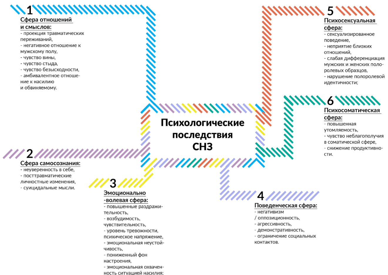
Рис. 1. Распределение негативных психологических признаков СНЗ по основным сферам психической деятельности и поведения

На втором этапе исследования сравнивались выраженность и характер проявления негативных признаков последствий СНЗ в группах здоровых потерпевших и потерпевших с диагностированными психогенными расстройствами. Для этого было выделено 29 психологических негативных признаков последствий СНЗ, которые были объединены в 6 сфер психической деятельности (рис. 1).