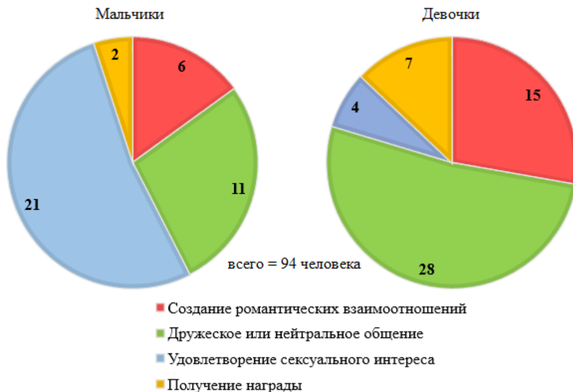
Рис. 1. Причины, по которым несовершеннолетние контактировали с посягателями

Все вышесказанное обусловило необходимость определить причины, побуждающие детей и подростков к взаимодействию с посягателями, поэтому на втором этапе исследования были определены четыре основных вида таких мотивов (рис. 1).