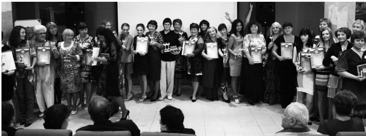
Лауреаты Всероссийского конкурса психолого-педагогических программ

На семинаре-мастерской «Новые технологии в психологии» авторы демонстрировали возможности своих программ и технологий. Проходило их активное обсуждение. Слушатели задавали много вопросов, связанных с их практической применимостью. Семи-