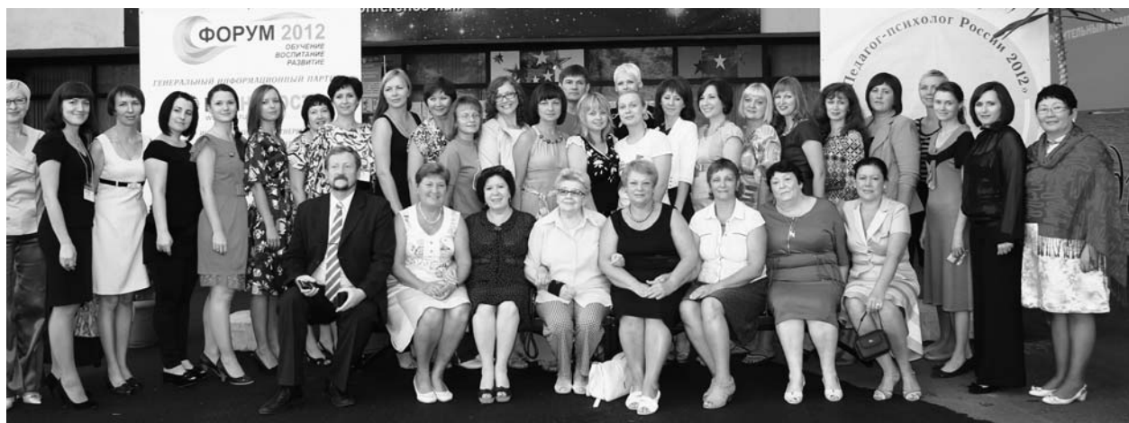
Участники конкурса «Педагог-психолог России — 2012»

По решению жюри второе место и звание победителя Всероссийского конкурса профессионального