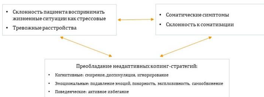
Рис. 3. Взаимосвязь между когнитивно-аффективными процессами, эмоциональными симптомами и желудочно-кишечными реакциями (по Д. Нелковской и соавторами, 2020 [35])

и специфика когнитивно-аффективных процессов пациента могут непосредственно влиять на функционирование кишечника и способствовать развитию симптомов СРК и коморбидных психических расстройств, лечение должно быть направлено на усиление у пациента навыков выражения и регуляции эмоции. В частности, симптомы СРК у пациента образуют порочный круг, который часто является следствием преобладания у пациента неадаптивных копинг-стратегий совладания со стрессом, примитивных форм защитных механизмов со склонностью к соматизации [35].