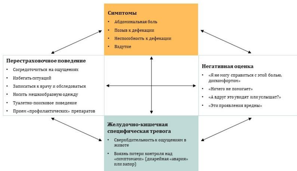
Рис. 4. Интероцептивная модель желудочно-специфической тревоги при синдроме раздраженного кишечника (цит. по [48])

На рис. 4 представлена интероцептивная модель желудочно-специфической тревоги при СРК (Gastrointestinal specific CBT model of IBS [48]).