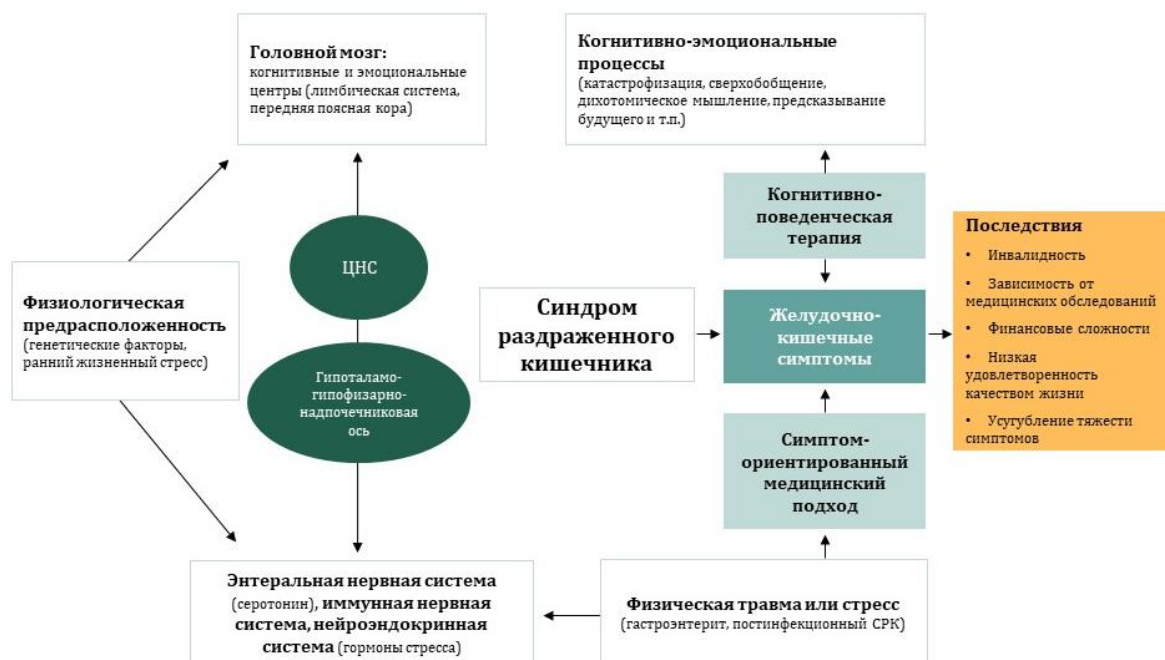
Рис. 2. Биопсихосоциальная тактика минимизации синдрома раздраженного кишечника (по Л. Кеефер и А. Беделл [24])

При рСРК соматотропная терапия (антибиотики, антидиарейные и спазмолитические препараты, пробиотические добавки, витамин D) часто обладает низкой эффективностью и используется самим пациентом как «перестраховочная» форма поведения [35], например, в виде приема Лоперамида (2-4 таблетки и более) перед выходом из дома. Некоторые мета-анализы показывают эффективность психофармакотерапии для снижения абдоминальной боли и нормализации моторики кишечника. Другие исследования показывают, что из-за высокой соматизации и повышенной чувствительности к побочным эффектам эффективность ТЦА и СИОЗС ниже, чем у гастроэнтерологической терапии, также наблюдается плохой ответ на спазмолитики [5; 16; 33; 35; 43]. До 50% пациентов искажают дозировки препаратов, используют формы альтернативного лечения, злоупотребляют спазмолитиками [34], что усиливает болезнь-ориентированное поисковое поведение . В связи с этим Л. Кеефер и А. Беделл предложили биопсихосоциальную тактику лечения СРК (рис. 2), которая делает акцент на том, что это не расстройство «органа», а дисрегуляция оси «мозг (нервная система) – кишечник», которая протекает под влиянием негативных когнитивно-аффективных процессов. Эту дисрегуляцию у пациента можно устранить с помощью сотрудничества врача-гастроэнтеролога, психиатра и клинического психолога [24].