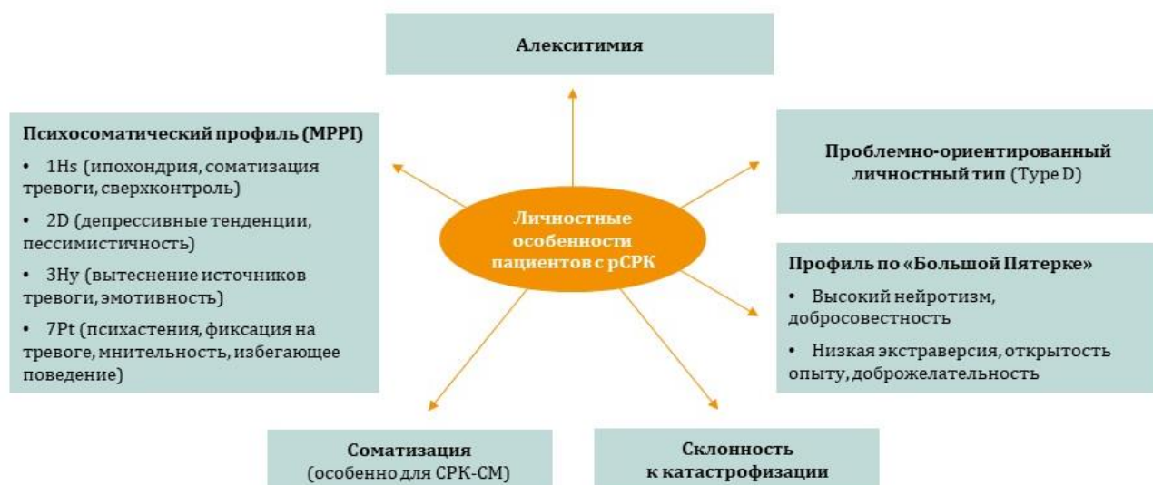
Рис. 1. Личностные особенности пациентов с рефрактерным синдромом раздраженного кишечника.

Каждый подтип СРК (запорный, диарейный, смешанный) имеет уникальный набор симптомов, когнитивных и поведенческих особенностей [26]. От 50 до 90% пациентов имеют одно или два коморбидных психических расстройств: тревожный спектр, соматоформное расстройство, рекуррентную депрессию, реже – булимический тип поведения. У 35–49% пациентов наблюдается пограничное личностное расстройство, у 4% – обсессивно-компульсивное расстройство личности, еще у 2% – тревожное [41]. Пациенты с СРК-СМ и рефрактерным течением имеют высокие уровни личностной, социальной тревоги и соматизации, нейротизма, социального дистресса, а также сниженное качество жизни по сравнению с запорным и диарейным типами. Присутствует целый спектр избегающего поведения (как при СРК-Д) и высокий уровень контроля поведения (как при СРК-З) [38; 43]. В жалобах пациентов с СРК и их поведенческих особенностях наблюдаются симптомы сепарационного тревожного расстройства [50], избегающего или тревожного стиля привязанности. Проанализировав ряд зарубежных исследований [15; 26; 37; 38–40; 42; 44; 48], мы выделили спектр личностных особенностей (рис. 1), которые влияют на течение симптомов и чувствительность к терапии.