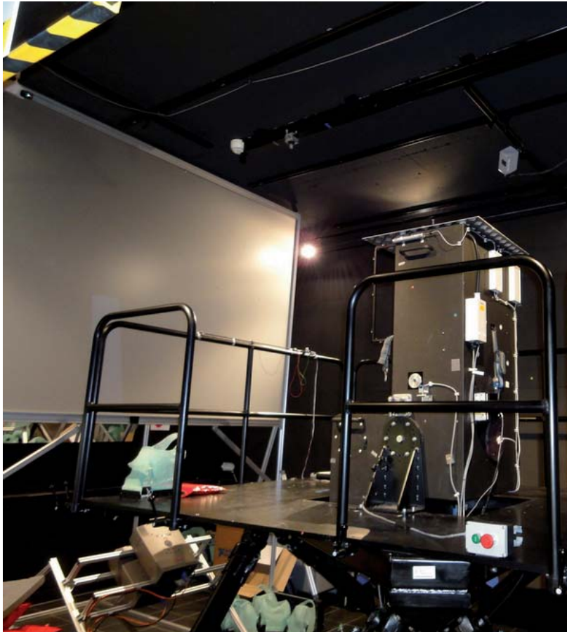
Рис. 2. Дополнительный айтрекер установлен на специальной подвижной платформе, которая может совершать вертикальные движения с различной скоростью, что позволяет проводить исследования движений глаз при различных краткосрочных перегрузках как положительных, так и отрицательных

В комплексе для исследований на айтрекере используется специальное кресло, которое может фиксироваться и поворачиваться в трех плоскостях, а сидящий в кресле испытуемый пристегивается ремнями безопасности, которыми обычно оснащены реактивные самолеты. Скорость вращения кресла вокруг вертикальной оси может достигать 450^\circ/\text{сек} . Таким образом, наряду с глазодвигательными исследуются и вестибулоокуломоторные реакции человека. Поворотный параболический экран используется при исследованиях периферического зрения, а также для сохранения соразмерности углов поворота глаза: поскольку все точки этого экрана равноудалены от глаз испытуемого, то поворот глаз из различных позиций (из прямой или из приведенной) на один и тот же угол в любом направлении приводит к образованию на поверхности экрана равных по длине дуг и, следовательно, свидетельствует о равном количестве информации, воспринимаемой испытуемым посредством зрительной перцепции. Голова испытуемого достаточно жестко крепится к плоскости спинки кресла с помощью тех масок, что используются при радиооблучении новообразований мозга. Даже при быстрых и/или резких движениях кресла, вызываемых мощными электродвигателями, голова испытуемого не совершает движений, что позволяет регистрировать на окулограмме только истинные движения глаз (рис. 2).