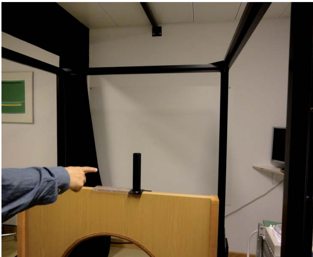
Рис. 3. Установка с айтрекером, одной из особенностей устройства которого является большого размера внешний куб

Профессор Доминик Штрауманн также отметил, что в планах лаборатории стоит изучение глазодвигательной активности человека при перемещении его в капсуле по линейной траектории с различными скоростями и ускорениями; для этих целей в исследовательском комплексе осуществлена укладка специальных рельсов, по которым в скором времени будут перемещаться специальные капсулы; именно в эти капсулы помещается испытуемый, причем положение его тела в пространстве капсулы может меняться. Кроме того, большое количество экспериментальных исследований имеют непосредственное отношение к решению задач практической медицины и вопросов оптимизации лечебно-диагностического процесса в университетской Клинике.