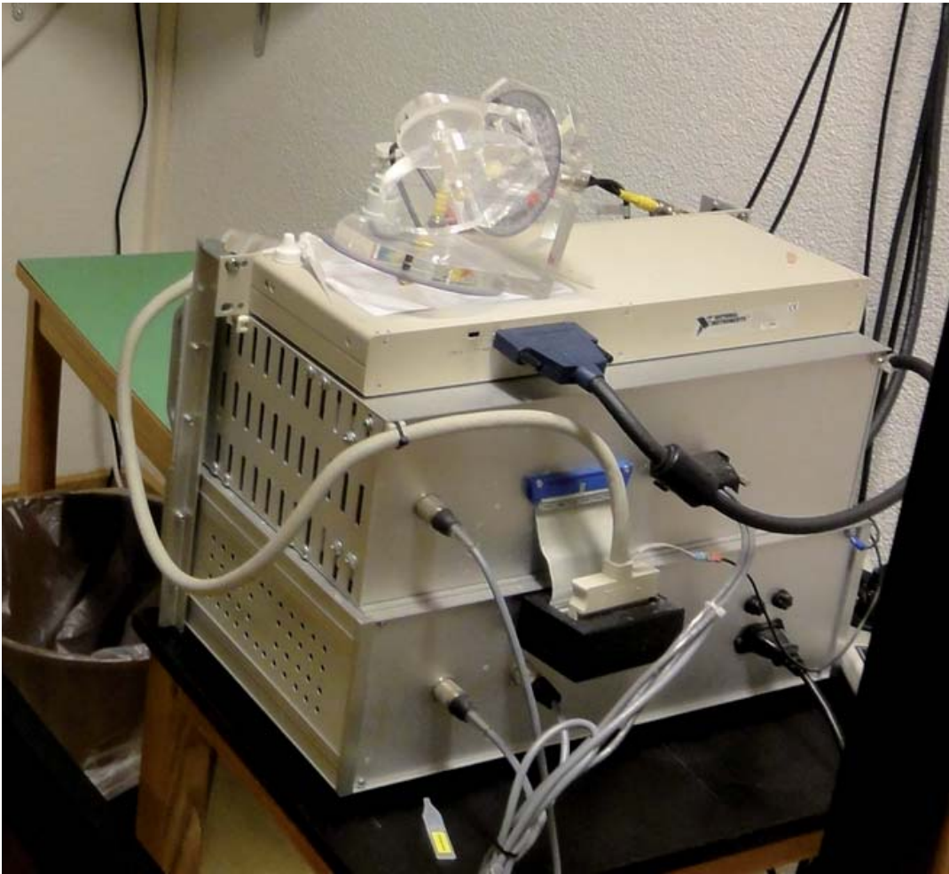
Рис. А. Калибровочный прибор

В калибровочном приборе кольцо поворачивается в трех плоскостях по очереди, что обеспечивает наиболее точную фиксацию соответствующих значений снимаемых электрических показателей, а также делает возможной калибровку аппаратуры в нескольких направлениях. Кроме того, данный прибор позволяет регистрировать так называемые «движения манекена». Если при тестировании аппаратуры SMI (Барабанщиков, Окутина, Окутин, 2010; Окутин, Окутина, 2011) нами был использован манекен в статическом положении, то в данном случае есть возможность вращать вручную закрепленное на калибровочной площадке кольцо (манекен) в трех плоскостях поочередно или одновременно, что создает необходимые условия для экстракции аппаратных артефактов из окулограмм и регистрации лишь истинных движений глаз.