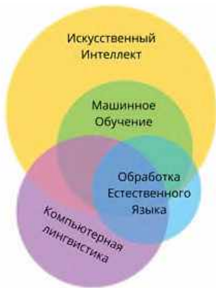
Рис. 1. Взаимоотношения между компьютерной лингвистикой, обработкой естественного языка и машинным обучением

Машинное обучение — третья область, часто упоминаемая вместе с компьютерной лингвистикой и обработкой естественного языка — появляется изначально отдельно от них и в первую очередь является набором методов, которые используются для решения определенных задач (рис. 1). Сочетая продвинутые статистические методы с теорией и возрастающей вычислительной мощностью компьютеров, машинное обучение оказывается способно моделировать закономерности, которые человек усмотреть не способен. Поэтому в последние годы, и особенно с распространением нейронных сетей, машинное обучение оказывается важной частью исследований, как в компьютерной лингвистике, так и в обработке естественного языка [13] (рис. 1).