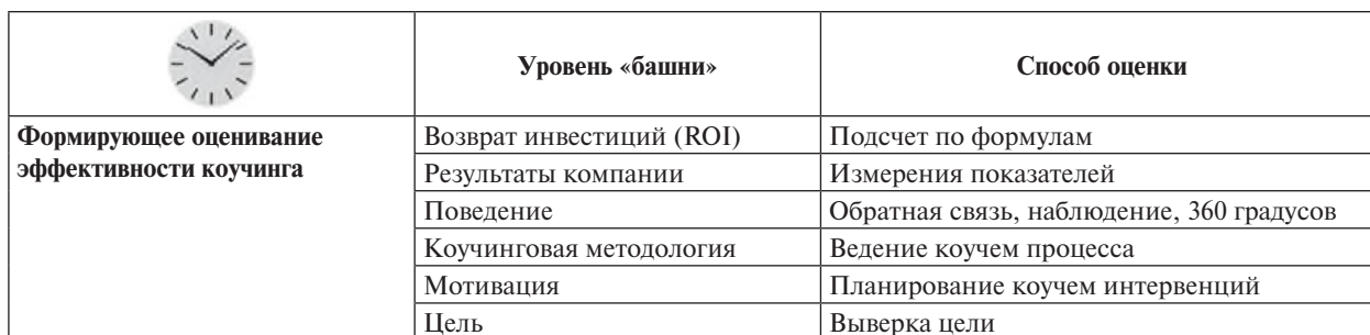
Модель оценки эффективности коучинга в организации