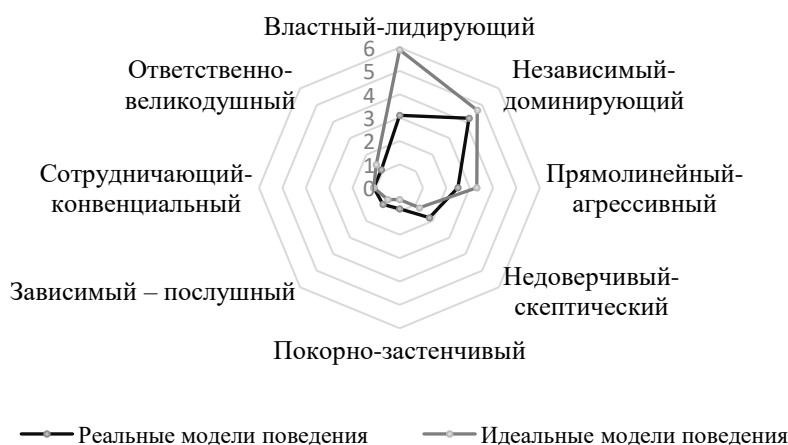
Рис. 2. Сравнение показателей реальных и идеальных моделей поведения в межличностных отношениях у представителей группы наставников

Идеальные представления группы наставников о моделях межличностных отношений свидетельствуют о наличии внутриличностного конфликта, при котором Я-реальное и Я-идеальное не совпадает (рис. 2).