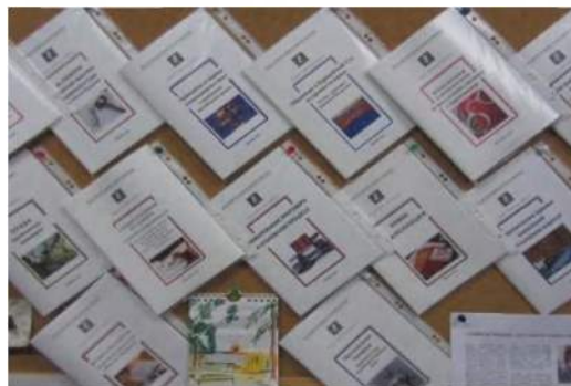
Рис. 2. Серия «Знай свои права!»

В 1992 году Центр содействия реформе уголовного правосудия выпустил книгу «Как выжить в советской тюрьме» («В помощь узнику»), значительная часть которой посвящена правам человека в системе уголовного правосудия. Весь тираж книги (60 тыс. экз.) быстро разошелся, более 40 тысяч книг бесплатно распространено среди заключенных и их родственников, отправлено по почте сотрудникам уголовно-исполнительной системы, правозащитникам, юристам. Это можно считать началом, провозвестником серии «Знай свои права». Мы получили множество откликов, в ответ публиковали отдельные главы, к примеру «Как сохранить здоровье в тюрьме», а в Центр продолжают поступать письма от заключенных и их родственников с различными вопросами и просьбами. Очень часто вопросы повторяются, и, понимая, что на каждое письмо ответить мы не можем, на многие вопросы мы отвечаем в брошюрах серии «Знай свои права!» (рис. 2). Эти брошюры, как правило, посвящены одной большой теме, например: «Порядок УДО», «Обжалование приговора в уголовном процессе», «Правила внутреннего распорядка» и т.д.