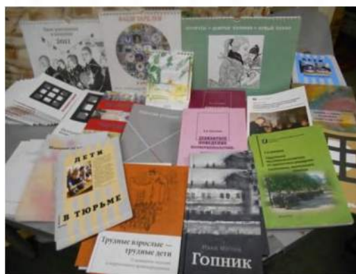
Рис. 1. Серия «Дети в тюрьме»

Печатную продукцию Центра содействия условно можно разделить на две части – вот это взрослым, а это для подростков. Но темы часто пересекаются и дополняют друг друга: книжки «детской» серии будут полезны взрослым, которые занимаются с подростками – к примеру, сборник «Осторожно, тюрьма!», а взрослая серия «Знай свои права!» пригодится юным читателям, которые, к несчастью, оказались за решеткой («Как сохранить свое жилье» или «Правила переписки»).