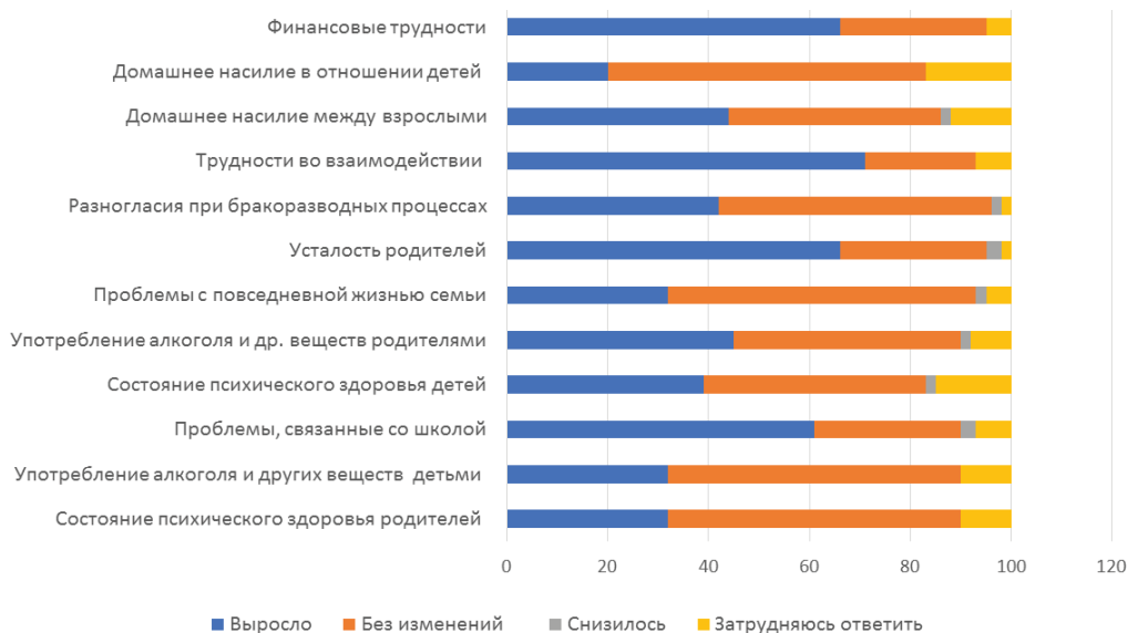
Рис. 1. Воздействие последствий коронавируса на благополучие детей и семей, которые являются клиентами органов защиты детей (осень 2020 года)