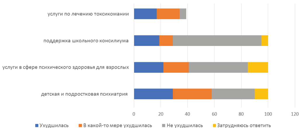
Рис. 2. Степень доступности других социально-медицинских услуг, необходимых для поддержки семьи (осень 2020 года)

По данным опроса, потребность в помещении ребенка вне семьи, установлении замещающей опеки или немедленном изъятии из семьи осенью 2020 года увеличилась. Опрос показал, что наибольшая часть респондентов считает, что ситуация не изменилась (54%). С другой стороны, почти 40% респондентов считают, что потребность, наоборот, выросла, что является довольно значительным показателем роста проблем (рис. 4).