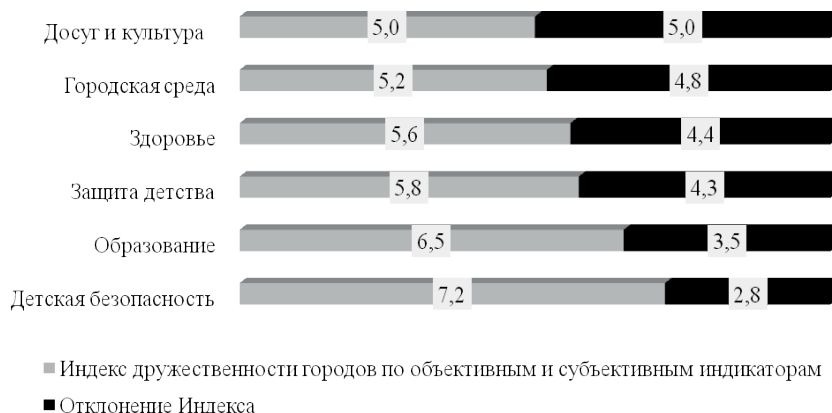
Рис. 2. Индекс дружелюбности городов к семье и детям по блокам, опрос 2021 г., родители детей 0-12 лет, дети 13-17 лет, балл

По всем параметрам в целом большинство детей и родителей положительно оценивают дружелюбность городской среды. Рассчитав индексы по каждому блоку, мы видим, что ни один из них не дотягивает до 10 — до максимально благоприятного условия (рис. 2).