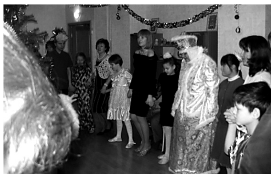
ДЕТИ ВСТАЛИ В ХОРОВОД