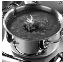
НАТА ЕСТ СУП

показывала выложенные карточки-слова по порядку, а учительница их прочитывала.