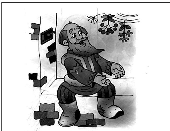
ЖИЛИ ДЕД И БАБА