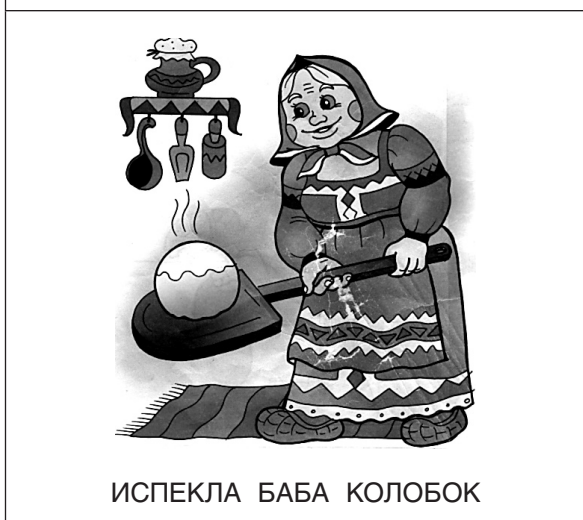
ИСПЕКЛА БАБА КОЛОБОК