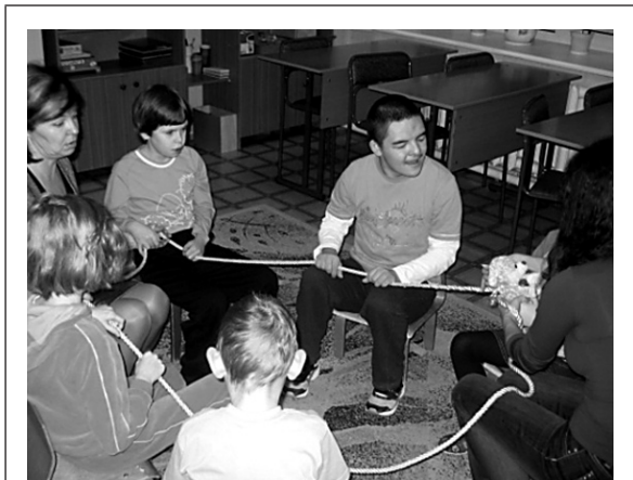
НАТА ЗАНИМАЕТСЯ В ГРУППЕ