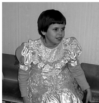
НАТА ЛЮБИТ ПРАЗДНИК