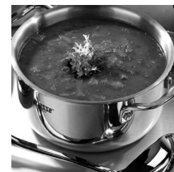
МАМА ЮЛЯ ВАРИТ СУП БОРЦ