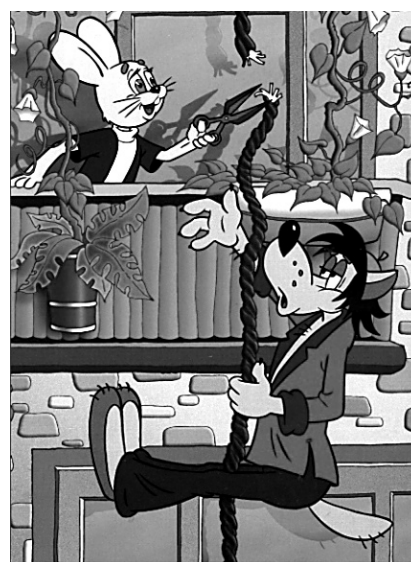
ЗАЯЦ ОТРЕЗАЛ ВЕРЕВКУ ВОЛК ЛЕЗЕТ ПО ВЕРЕВКЕ