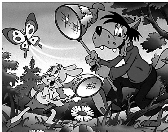
ЗАЯЦ СМОТРИТ НА БАБОЧКУ ВОЛК ДЕРЖИТ САЧОК

Книга «Волк и заяц» сделана на основе очень хорошо знакомых Наташе картинок. Это пазлы, которые Ната собирала.