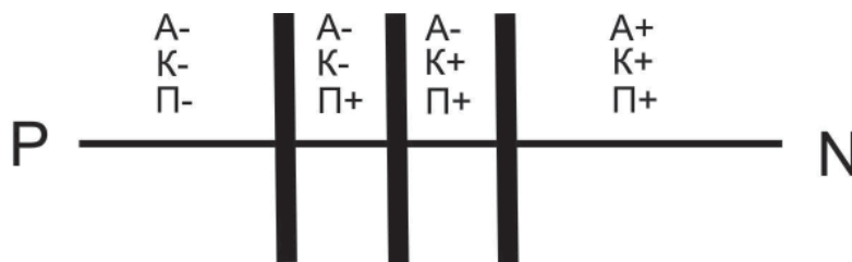
Рис. 2. Оценка нормы и патологии по комбинированному критерию. Выраженность частных критериев разграничения нормы и патологии, включая пограничные нарушения и временное психическое неблагополучие:

«А+» – адекватность; «А-» – неадекватность; «К+» – критичность; «К-» – некритичность; «П+» – продуктивность; «П-» – непродуктивность