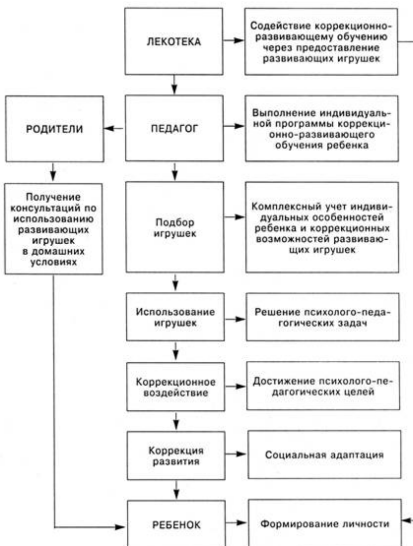
Модель корригирующего влияния лекотеки

Согласно модели корригирующего влияния лекотеки педагог, обращаясь к фонду, подбирает необходимые развивающие игрушки для целенаправленного воздействия на ту или иную сторону развития психики ребенка. Непосредственным объектом корригирующего влияния лекотеки является ребенок, его формирующаяся личность.