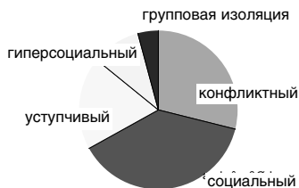
Рис. 1 Распределение типов взаимодействия

Самая многочисленная группа – это дети с социальным типом межличностного взаимодействия (8 детей из 21). Здесь преобладают девочки. Дети конфликтного типа взаимодействия по своей численности составили вторую группу, в которую вошли пять мальчиков и одна девочка. У четырех мальчиков выявлен уступчивый тип взаимодействия, а гиперсоциальный тип – у двоих. Такой тип межличностного взаимодействия как групповая изоляция был выявлен только у одного мальчика.