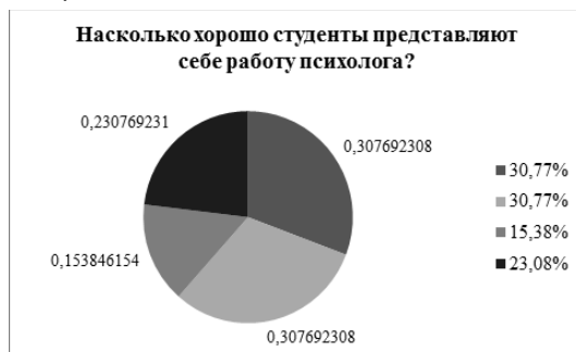
Рис. 3. Оценка представлений студентов о своей будущей работе

Насколько удастся студентам с ОВЗ успешно сочетать обучение с повседневной жизнью, работой, другой учебой или деятельностью иного рода, можно сделать вывод по табл. 4.