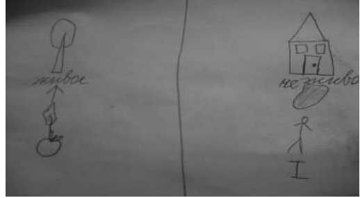
Рис. 2. Запись пиктограммами в индивидуальном листе

Составляется таблица, а варианты дети с помощью учителя зарисовывают в виде пиктограмм (рис. 2). В процессе обсуждения делаем выводы о том, что неживое меняет человек, живое (маленькое дерево) подчинено законам природы.