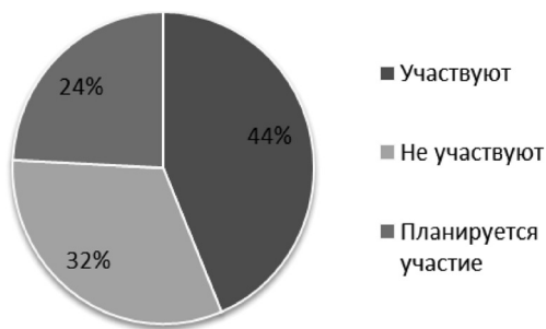
Рис. 3. Участие организаций в реализации межведомственных моделей оказания социальных и образовательных услуг