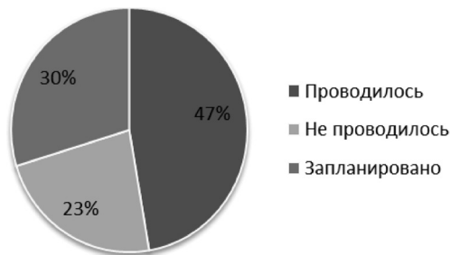
Рис. 2. Обучение работников в целях приведения в соответствие их квалификации требованиям профессионального стандарта