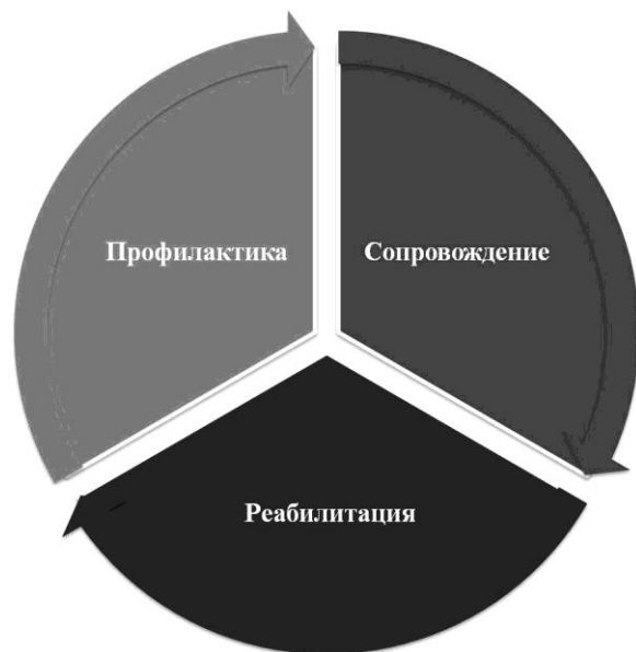
Рис. 1. Сфера деятельности юридического психолога

Каждое из направлений деятельности включает в свою структуру определенные этапы деятельности (рис. 2). Для того чтобы лучше понять содержание деятельности юридического психолога необходимо представить определения данных видов деятельности.