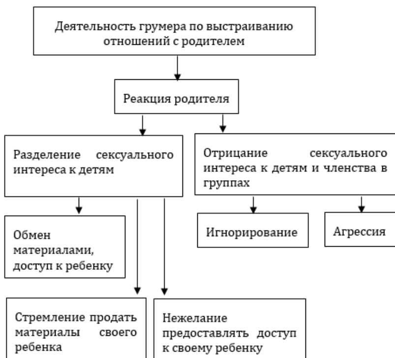
Рис. 3. Динамика коммуникаций кибергрумеров с родителями группы 3

В группе 3 многие родители (30,3% от всех случаев) признавали наличие у себя сексуального интереса к несовершеннолетним и сообщали о фото-/видеофиксации соответствующих действий со своими детьми. Готовность обеспечить собеседнику доступ к данным материалам наблюдалась у матерей и отцов при условии равнозначного обмена или денежного вознаграждения, либо отсутствовала по причине нежелания делиться. В то же время часть родителей (24,2% от всех случаев) указывали преступникам на ошибочность их коммуникативных действий и случайность своего членства в сообществах (например, из-за «взлома страницы»), реагировали агрессивно и отказывались от общения.