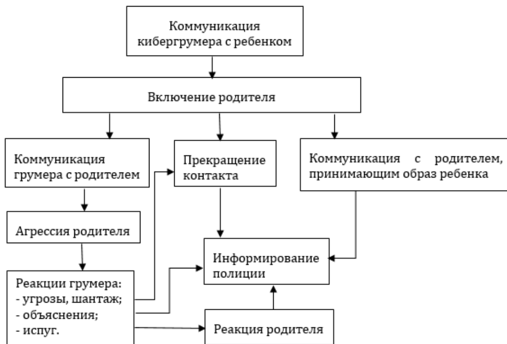
Рис. 1. Динамика коммуникаций кибергрумеров с родителями группы 1

Родители группы 1 преимущественно (15,1% от всех случаев) реагировали агрессивно, порицали злоумышленников, стремились пресечь их действия в отношении ребенка и угрожали сообщить о них в правоохранительные органы. Одна мать резко пресекла общение своего ребенка без каких-либо вербальных реакций в сторону его собеседника. Другая продолжила общаться со злоумышленником от имени своего ребенка и в его присутствии, побуждала преступника к ведению переписки сексуального характера, присылала фотографии своей дочери и получала от собеседника его интимные материалы с целью его компрометации, однако данный случай представляется нестандартным.