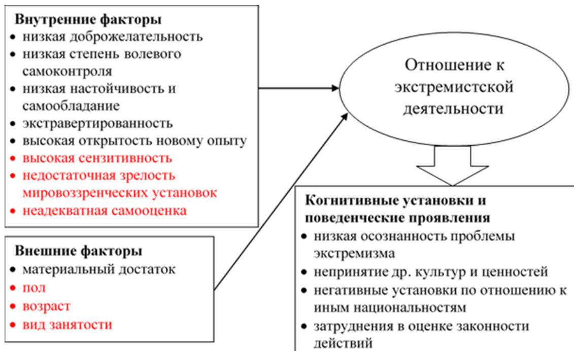
Рис. 1. Модель изучения личности, подверженной экстремистским установкам