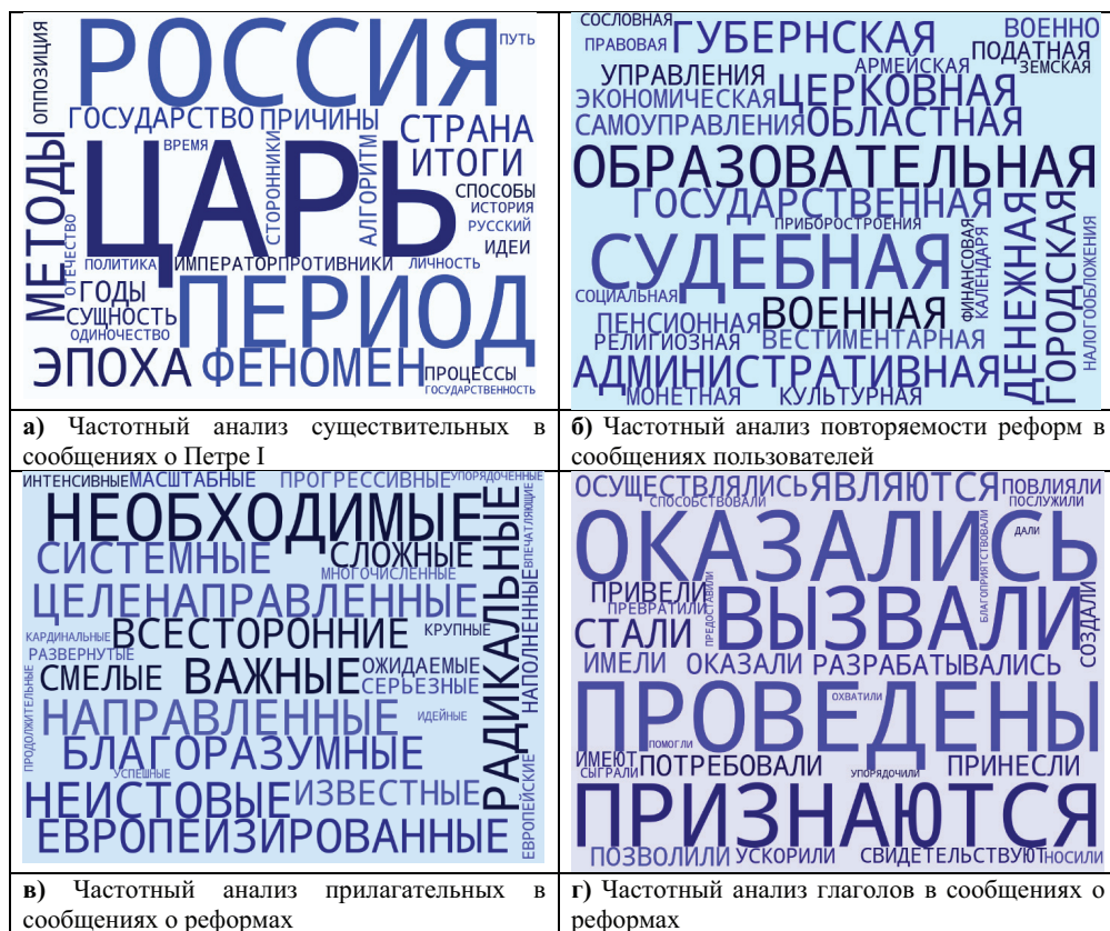
Рис. 1. Результаты оценки частотного анализа слов в сообщениях пользователей социальной сети Twitter

представленных в сообщениях пользователей реформ отличается многообразием, а также указывает на важное их значение (судебная, военная, образовательная, экономическая, административная, денежная и т.д. — рис. 1б). На рис. 1в, 1г представлен частотный анализ прилагательных (необходимые, важные, целенаправленные, системные, сложные, благоразумные и т.д.) и глаголов (оказались, проведены, признаются, ускорили, позволили и т.д.), которые также свидетельствуют об эпохальности и масштабах реализованных Петром I политических свершений.