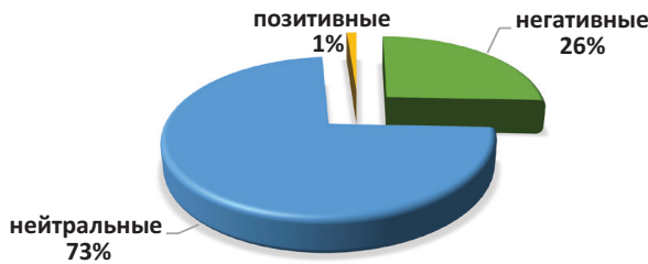
б) Распределение эмоционального фона сообщений по трехбалльной шкале (%)