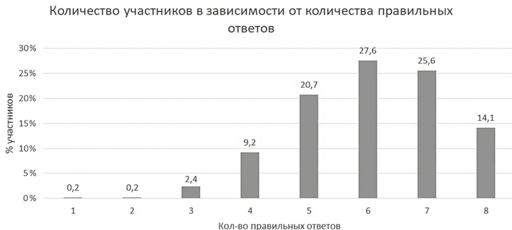
Рис. 1. Соотношение количества участников и количества правильных ответов

На вопрос, где можно в Санкт-Петербурге сдать анализ на ВИЧ, смогли назвать соответствующее учреждение 60,1 %, и на вопрос о том, как определить наличие ВИЧ у человека, правильно ответили 78,4 %. То есть 39,9 % участников не владеют информацией, где можно узнать свой ВИЧ-статус, а 21,6 % ошибаются в ответах о механизме тестирования.