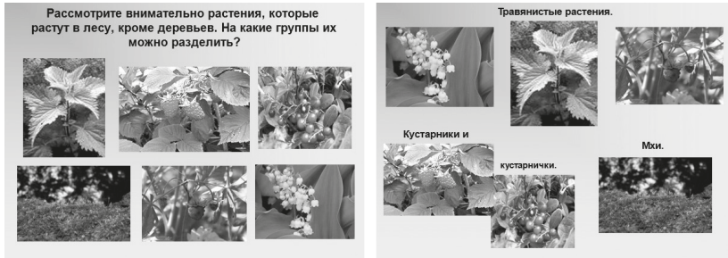
Рис. 1. Типичный вопросно-ответный характер организации детской активности с помощью презентации. а слайде 1 (слева) ученикам задан вопрос, на слайде 2 представлен правильный ответ.

В то же время возможности Power Point как простейшего цифрового инструмента организации детской активности чрезвычайно велики. Для примера рассмотрим презентацию, предоставляющую ученикам возможность планирования собственных действий, принятия решений, получения обоснованного, но не единственно возможного ответа. Такого рода презентация может использоваться как в классе при демонстрации на экране и осуществлении действий с принятием общего решения, так и в групповой, парной, индивидуальной работе (рис. 2).