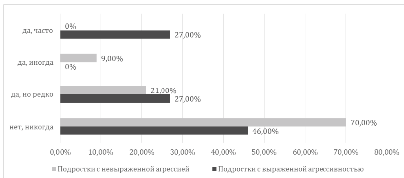
Рис 2. Частота использования выражения собственных эмоций и отношений бранными словами, оскорблениями, нецензурной лексикой

Интересы подростков с выраженной агрессивностью также включают регулярный просмотр неблагоприятного контента (видео с проявлением жестокости в отношении животных и людей, «взрослый контент 18+», пропаганда наркотиков и оружия и т.д.). Такого рода контент периодически просматривает треть подростков с выраженной агрессивностью (36 %), тогда как среди подростков с невыраженной агрессивностью подобный контент просматривает только 9 % подростков.