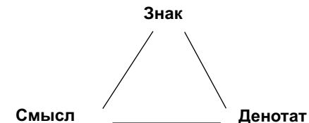
Рис. 1. Треугольник Фреге

Ключевым понятием здесь является понятие «знак». Знак – это минимальный носитель языковой информации. Совокупность знаков образует языковую систему, или язык. Знак имеет план выражения – денотат , т. е. с одной стороны знак материален, и план содержания, т. е. является носителем смысла . Структура знака представлена треугольником Фреге: