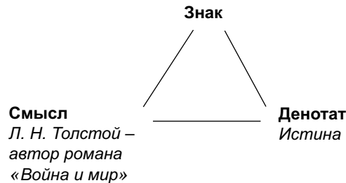
Рис. 2. Треугольник Фреге – Истина

нотатов у предложения два: истина или ложь . Истина здесь – это соответствие высказанного суждения реальному положению вещей, а ложь, наоборот, несоответствие.