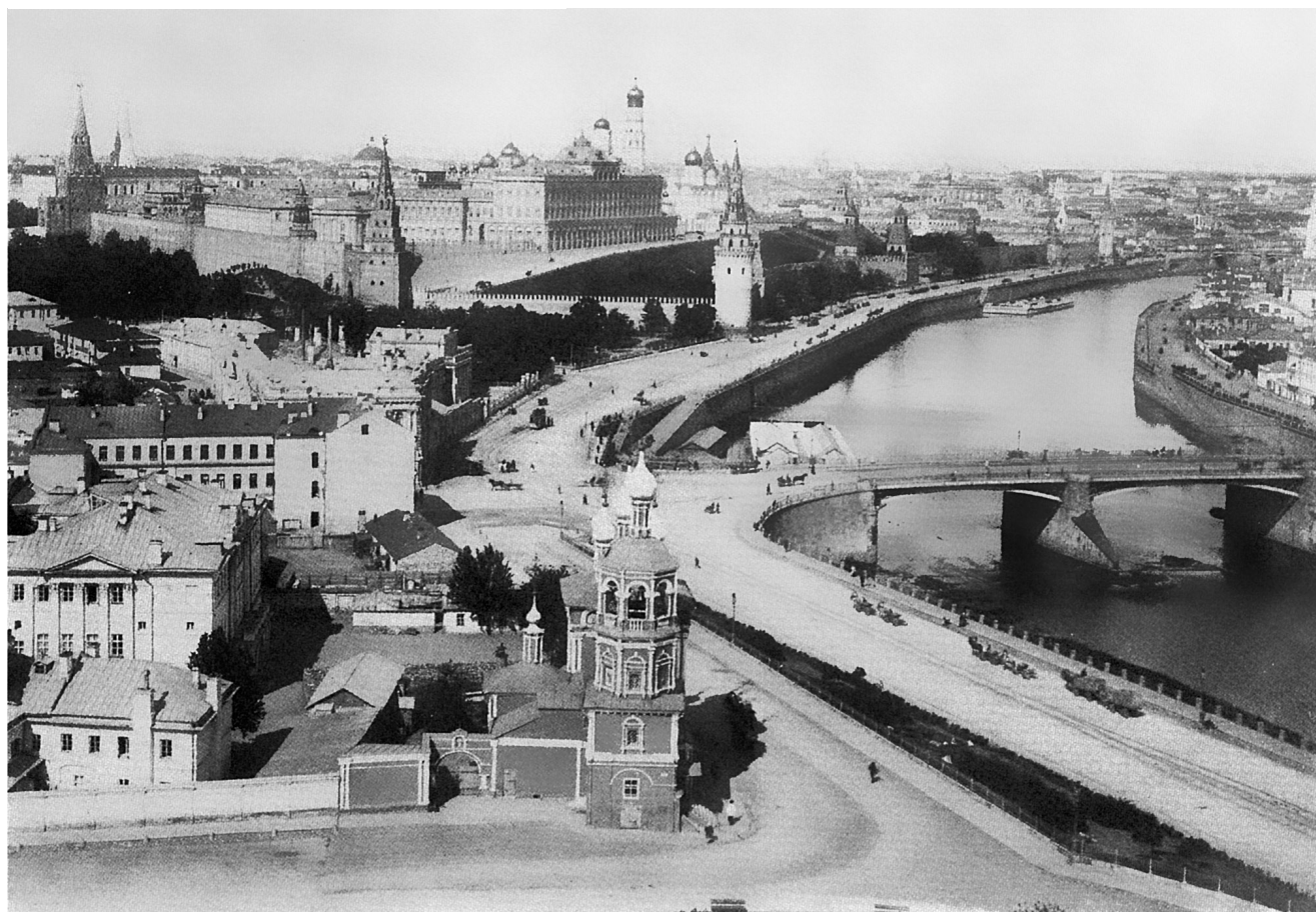
Общий вид Кремля

науке, Толстой ставил на первое место то, «что мы с Николаем Яковлевичем, хотя и по разным радиусам, но оба шли к тому одному центру, который соединяет всех, и что мы оба сознавали это, и поэтому наши дружеские отношения никогда не прерывались» 15 . Грот ввел Льва Николаевича в состав Психологического общества. Толстой присутствовал на его заседаниях. На одном из них он выступил с докладом «О понятии жизни», который получил большой резонанс в московском обществе и подтолкнул к дальнейшей работе Толстого над