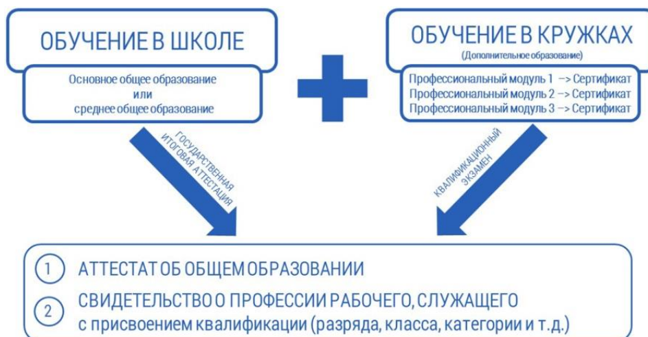
Рис. 2. Профессиональное обучение в кружках дополнительного образования на базе школы или организации дополнительного образования

Школьник, получая основное образование или среднее общее образование, параллельно посещает кружок дополнительного образования, где осваивает один из модулей профессиональной подготовки и получает сертификат. Освоив набор компетенций, соответствующих требованиям профессионального стандарта, сдает квалификационный экзамен и по результатам получает свидетельство о профессии рабочего, служащего с присвоением квалификации (разряда, класса, категории и т.д.). Количество занятий и форма обучения (индивидуальная, дистанционная или в группе) определяются образовательной организацией в соответствии с содержанием программы и условиями обучения.