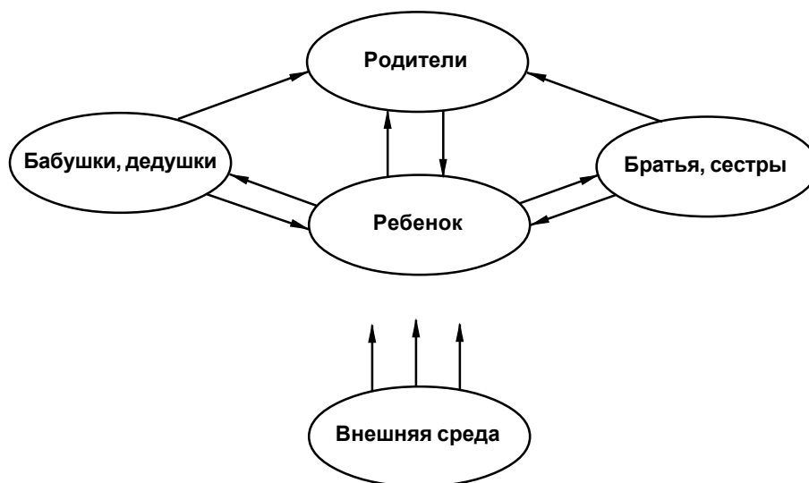
Рис. 1. Взаимодействие гиперактивного ребенка в семье

ствует несколько категорий гиперактивных детей, то и проявления заболевания в разных случаях могут быть разными. Так, иногда родителей, пришедших к психологу или врачу, больше всего беспокоит дефицит внимания ребенка, который вследствие этого имеет стойкие проблемы с обучением. Другие родители, особенно если ребенок — дошкольник, обеспокоены чрезмерной подвижностью сына или дочери. Именно поэтому психолог, консультирующий родителей и ребенка с СДВГ, должен иметь в виду, что в каждой конкретной семье могут возникать трудности, не похожие на проблемы других. Характер и размер трудностей обусловлен серьезностью синдрома у конкретного ребенка, наличием сопутствующих состояний, особенностями данной семьи и требованиями, предъявляемыми к ребенку. Все это затрудняет работу не только психолога, но зачастую создает проблемы и при постановке диагноза врачом.