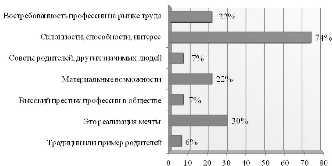
Рис. 2. Причины выбора профессии

В ходе опроса у школьников интересовались, чем они руководствуются при выборе будущей профессии (рис. 2).