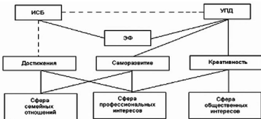
Рис. 1. Структурограмма корреляционных взаимосвязей между параметрами субъективного благополучия и этноидентификационной матрицы и аксиологической направленности в выборке русских: ИСБ — индекс субъективного благополучия, УПД — удовлетворенность повседневной деятельностью, ЭФ — этнофанатизм

Структурограмма корреляционных взаимосвязей параметров субъективного благополучия и этноидентификационной матрицы и аксиологической направленности (см. рис. 1) отражает то, что локус аксиологической направленности проявляется преимущественно в сфере профессиональной деятельности, сфере общественных интересов и сфере семейных отношений. Достижение успеха в сфере профессиональной деятельности, возможность творческой самореализации