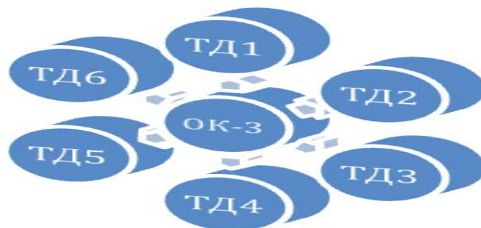
Рис. 1. Влияние компетенции ОК-3 на формирование ряда трудовых действий педагога