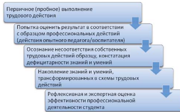
Рис. 4. Схема движения студента по образовательной траектории ОПОП

взрослого (воспитателя) в пространство социального взаимодействия, а также методологическое и инструментальное освоение данного пространства.