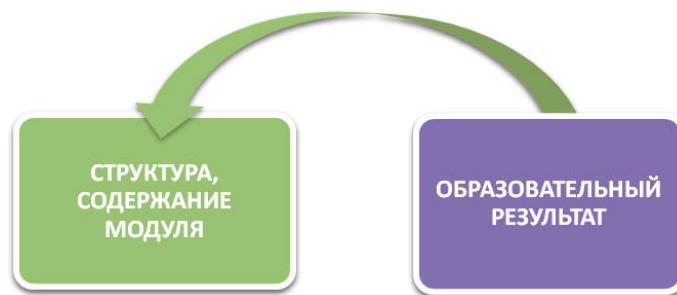
Рис. 3. Логика содержательного наполнения модуля ОПОП

Принцип «построение деятельности от конечного результата» , т. е. организация содержания и форм построения образовательного процесса в вузе согласно требованиям Профессионального стандарта выстраивается от конечного результата — образова-