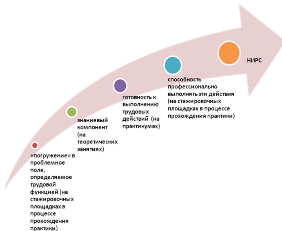
Рис. 1. Последовательность формирования трудовых действий: компоненты учебного модуля

Новая практика магистрантов становится включенным элементом модуля, его стержнем и логически поэтапно формирует закрепленные за модулем компетенции. Для каждого модуля устанавливаются исходные позиции при распределении ответственности за формирование компетенций или их частей между образовательными организациями – участниками школьно-университетского партнерства.