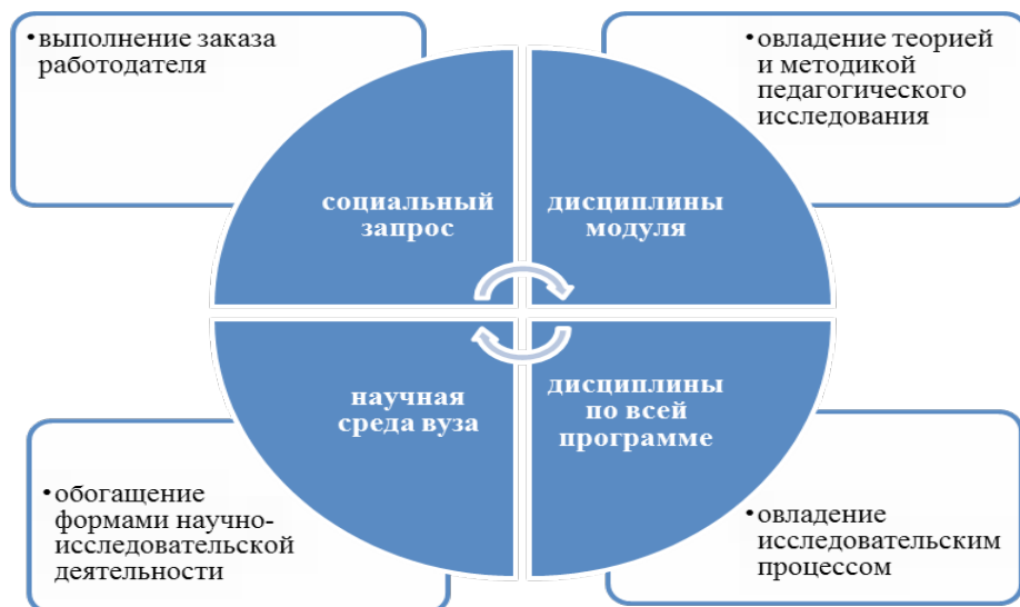
Рис. 2. Модель формирования исследовательской компетенции

Первый компонент – дисциплины исследовательского модуля. В рамках образовательной программы «Методология и методика социального воспитания» в исследовательский модуль включены следующие учебные дисциплины: «Методология и методика научного исследования», «Деловой ино-